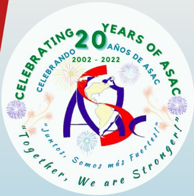
PHOTO GALLERY/ GALERÍA DE FOTOS