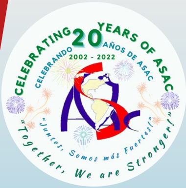
PHOTO GALLERY/ GALERÍA DE FOTOS