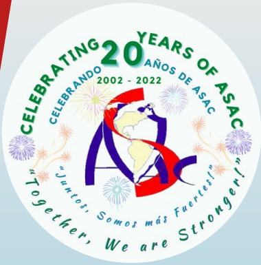
PHOTO GALLERY/ GALERÍA DE FOTOS