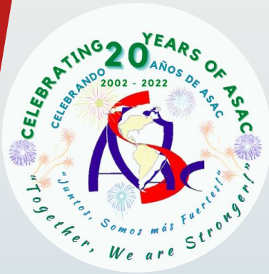
PHOTO GALLERY/ GALERÍA DE FOTOS