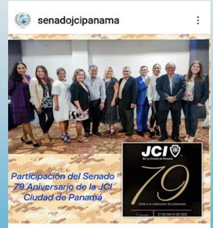
Aniversario JCI Ciudad de Panamá

“Together we are Stronger/ Juntos somos más Fuertes ”