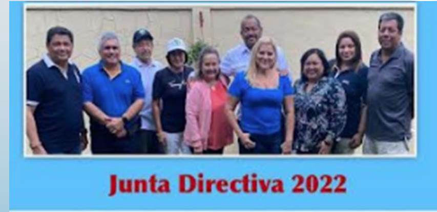
Reunión con el Senado de Colón 30/09/22