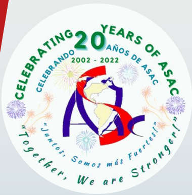
PHOTO GALLERY/ GALERÍA DE FOTOS