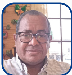
ZYDDI SANTI VISSUETTI DIRECTORADE DESASTRES

Fomentar el sentido de pertenencia de los Senados de América y el Caribe generando el orgullo de pertenecer a ASAC, a través de una comunicación positiva, la creación de una identidad de imagen reconocible y el posicionamiento de TODOS SOMOS ASAC como marca distintiva de ASAC 2023